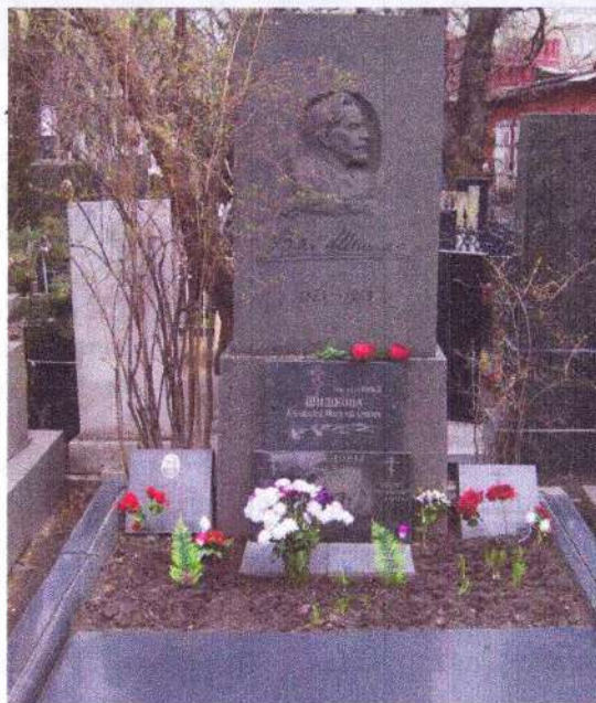
Могила Вячеслава Шишкова г. Москва, Новодевичье кладбище (участок № 2).

1979 г. - «Нескладуха» — советский короткометражный художественный фильм, поставленный на Киностудии «Ленфильм» режиссёром Сергеем Овчаровым по рассказу «Винолазы».