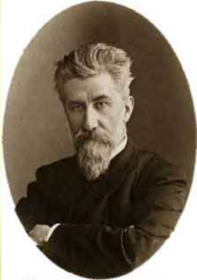
Дмитрий Николаевич АНУЧИН (1843-1923)

Русский ученый географ Дмитрий Николаевич Анучин посетивший эти глухие лесные места со своей экспедицией в 1894 - 1895 гг. выяснил, что исток реки это ручеек впадающий в озеро Двинец.