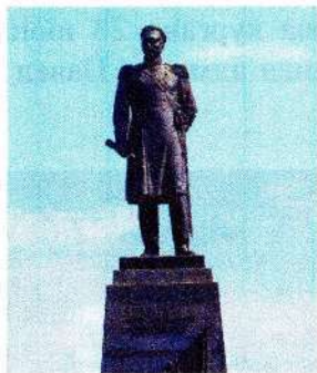
Памятник Павлу Нахимову в Севастополе

Именем Нахимова названы улицы, площади, переулки и проспекты во многих городах России. Кроме того, в 1959 году в Севастополе ему воздвигли памятник, автором которого является скульптор Николай Томской. Похожие памятники есть в Санкт-Петербурге, в Москве и Краснодаре. А на его родине - в Смоленской области, в Вязьме, установили бюст знаменитого земляка.