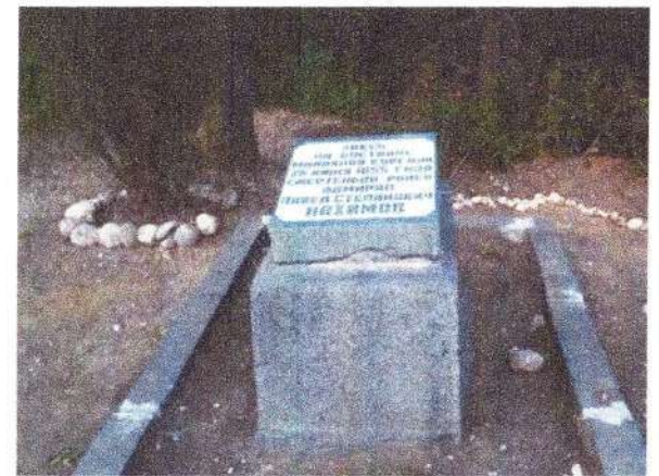
Памятная плита на Малаховом кургане

Оборона Севастополя отняла жизни огромного количества человек. Кровавый бой, длившийся почти 11 месяцев, не пощадил и адмирала, оборвав его жизнь на самом пике карьеры. Смертоносное ранение в голову, которое и стало причиной смерти, Павел Степанович получил летом 1855 года. На этом месте, где он получил выстрел, возвели памятную плиту. Вместо портрета флотоводца на ней высечены следующие слова: «Здесь на бастионе Малахова кургана 28 июня 1855 года смертельно ранен адмирал Павел Степанович Нахимов».