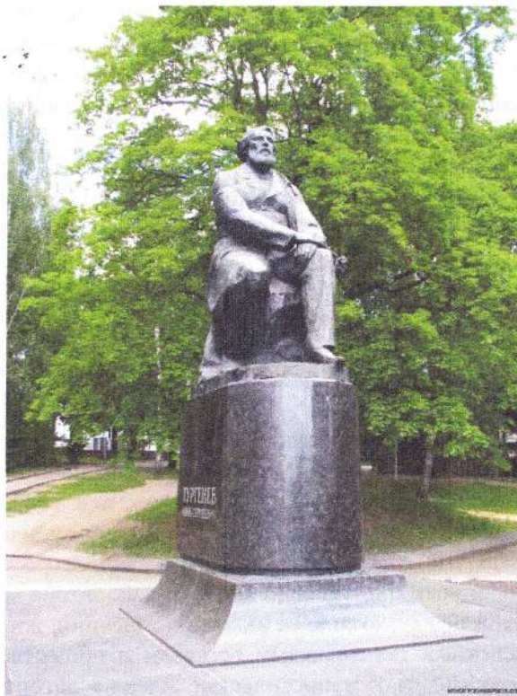
Памятник И. С. Тургеневу в городе Орле

Иван Сергеевич был большой ценитель искусства. С 1870-х годов, по его собственным словам, он заболел «картиноманией» — участвовал в аукционах, покупал картины и стал неплохо разбираться в живописи. Сам Иван Сергеевич тоже любил рисовать, особенно шаржи. Это увлечение началось с его детских рисунков, которые он оставлял на форзацах книг — читая, он как бы попутно иллюстрировал текст. Его письма и рукописи также сопровождались короткими зарисовками. Профессиональные художники отмечали талант Тургенева-рисовальщика, делавшего мастерские наброски на полях своих рукописей.